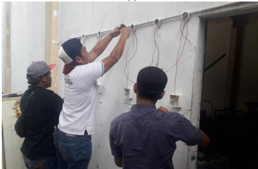
Gambar 2. (a) Sesi teori (b) Sesi Praktek

Adapun langkah pelaksanaan praktek dimulai dari menyiapkan alat dan bahan yang akan digunakan, penentuan tempat pemasangan komponen, instalasi PVC, kotak hubung sesuai dengan gambar selanjutnya, memasukan kabel kedalam pipa serta menyambung