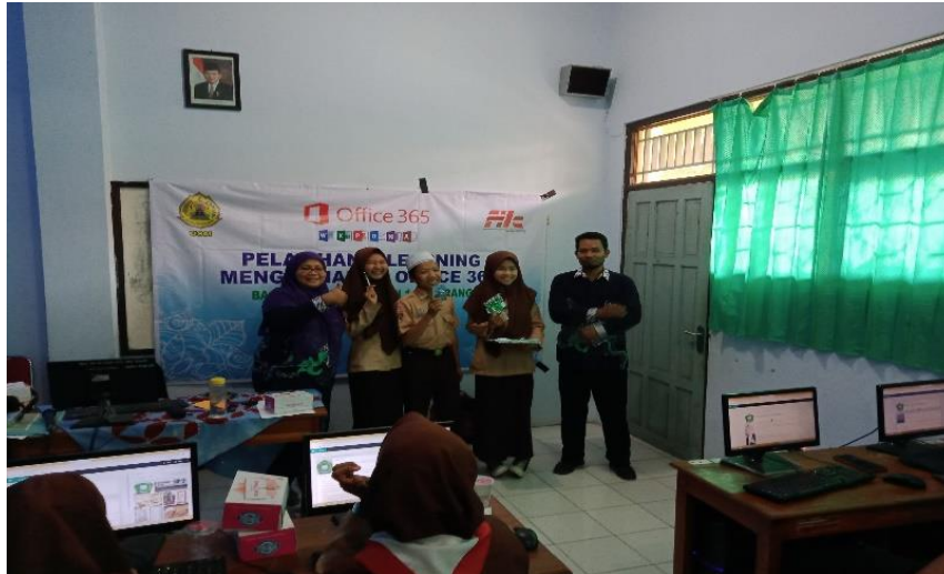
Gambar 4. Foto bersama penerima reward

Reward yang didapatkan berupa pulsa dan cinderamata dari tim pengabdian berupa alat tulis. Pada gambar 4. tampak foto dari 3 siswa yang berhasil mendapatkan reward dari tim pengabdian. Dan pada gambar 5, adalah bukti transfer pulsa bagi 3 siswa yang mendapatkan reward .