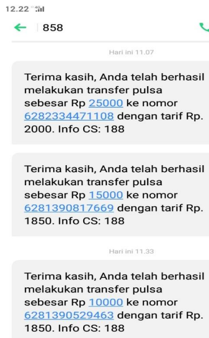
Gambar 5. Bukti transfer pulsa

Reward yang didapatkan berupa pulsa dan cinderamata dari tim pengabdian berupa alat tulis. Pada gambar 4. tampak foto dari 3 siswa yang berhasil mendapatkan reward dari tim pengabdian. Dan pada gambar 5, adalah bukti transfer pulsa bagi 3 siswa yang mendapatkan reward .