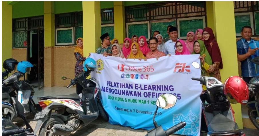
Gambar 9. Foto tim pengabdian dengan peserta guru-guru