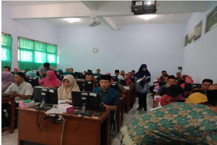
Gambar 6. Pelatihan hari kedua peserta guru-guru