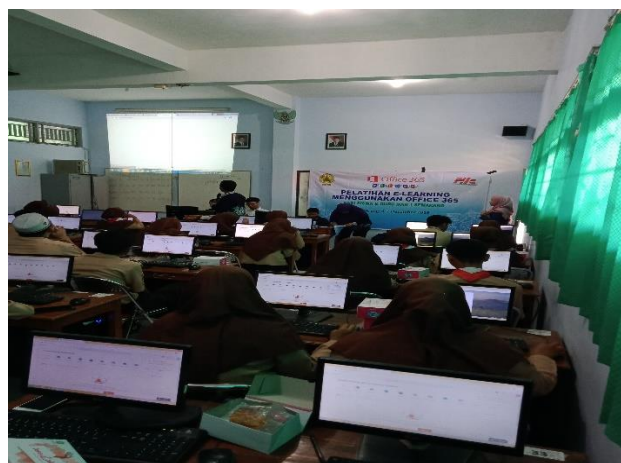
Gambar 2. Pelatihan hari pertama

Kegiatan Pengabdian Kepada Masyarakat ini mengambil tema : "Pengenalan dan Pembelajaran Microsoft Office 365", diselenggarakan selama 2 (dua) hari yaitu tanggal : 6 dan 7 Desember 2019 bertempat di laboratorium komputer MAN 1 Semarang, Jl. Brigjen Sudiarto Pedurungan Semarang diikuti oleh sebanyak 70 orang guru MAN 1 dan 38 siswa MAN 1 (daftar peserta terlampir). Hari pertama tanggal 6 Desember 2019 pelatihan diperuntukan untuk siswa kelas XI tampak pada gambar 2. pelatihan dimulai pukul : 7.00 WIB dan berakhir pukul : 11.00 WIB.