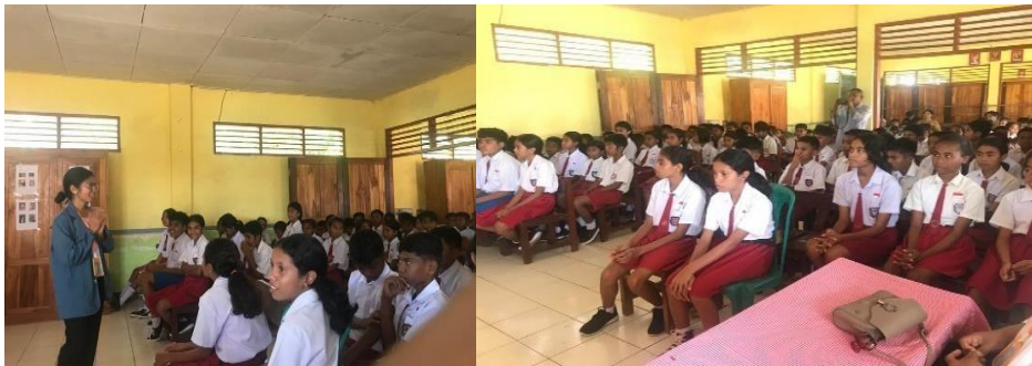
Gambar 3. Memberikan sosialisasi

Dalam tahapan ini, pengabdian juga menyarankan agar menggunakan media literasi digital dalam mengakses bacaan-bacaan yang terpercaya dan mengandung nilai-nilai moral atau berisi hal positif. Hal ini pengabdian sarankan agar peserta didik menyesuaikan diri dengan era revolusi industri 4.0. Dalam kegiatan tersebut. Sosialisasi tahap pertama dilakukan di SDK Balaweling dengan materi dan proses yang telah dipaparkan.