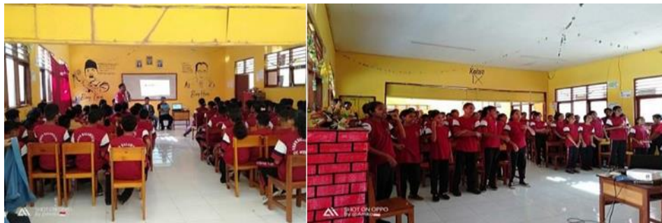
Gambar 5. Memberikan sosialisasi

Sosialisasi tahap kedua dilakukan di SMPN Balaweling dengan tujuan membangun budaya literasi agar siswa memiliki kemampuan berfikir kritis dan inovatif sehingga dapat dimanfaatkan oleh peserta didik dalam menciptakan karya monumental dan berdaya guna.