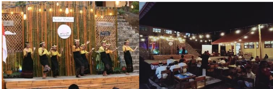
Gambar 7. Panggung Seni

Pada gambar 6, merupakan pendampingan untuk persiapan panggung seni yang akan di pentaskan pada saat acara pembagian amplop berita kelulusan peserta didik kelas IX SMPN Balaweling. Kegiatan ini dilaksanakan sejak tanggal 24 Mei- 7 Juni 2023.