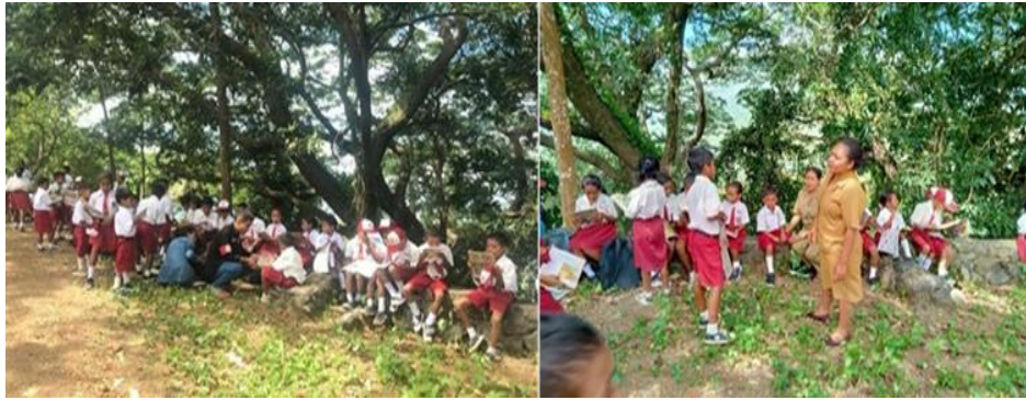
Gambar 4. Kegiatan baca bersama (Lapak Baca).

Pada gambar 4. Peserta didik menerapkan secara langsung tentang lapak baca yang dilaksanakan usai peserta didik mendapatkan materi pada tanggal 8 Mei 2023. Peserta didik diarahkan keluar kelas, dibagikan kedalam beberapa kelompok dan diberi kesempatan untuk memilih buku bacaan untuk dibacakan. Proses kegiatan didampingi oleh para guru dan peserta KKN-T, untuk melatih peserta didik membaca, menulis, berbicara, menghitung, dan bagaimana cara untuk memecahkan masalah pada tingkat keahlian tertentu.