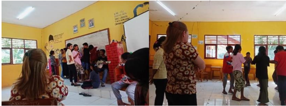
Gambar 6. Pendampingan untuk Panggung Seni

Pada gambar 6, merupakan pendampingan untuk persiapan panggung seni yang akan di pentaskan pada saat acara pembagian amplop berita kelulusan peserta didik kelas IX SMPN Balaweling. Kegiatan ini dilaksanakan sejak tanggal 24 Mei- 7 Juni 2023.