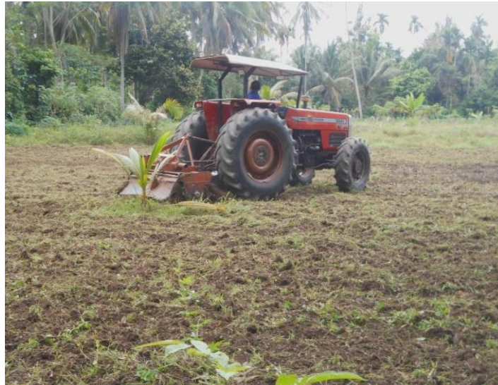
Gambar 2. Persiapan pengelolaan lahan tanam