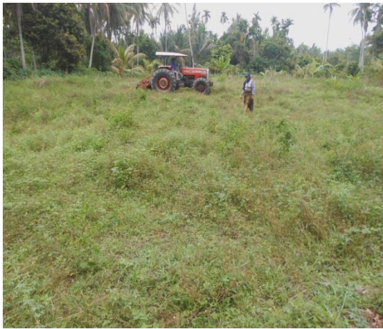
6A. Persiapan pembersihan lahan

olahan, yaitu rumput gajah seluas 3.000 meter persegi dan gudang tempat penyimpanan jerami seluas 6m x 8m. Ini meningkatkan kualitas peternakan sapi Aceh lokal Aceh di desa Blang Keutumba. Hasil dari pengabdian ini digambarkan pada Gambar 6.