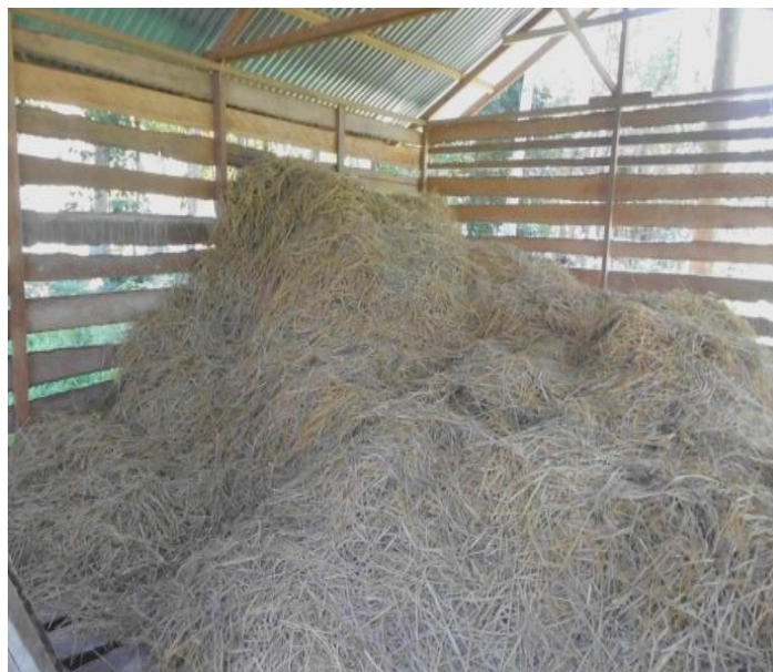
Gambar 3. Jerami yang diolah sebagai campuran pakan