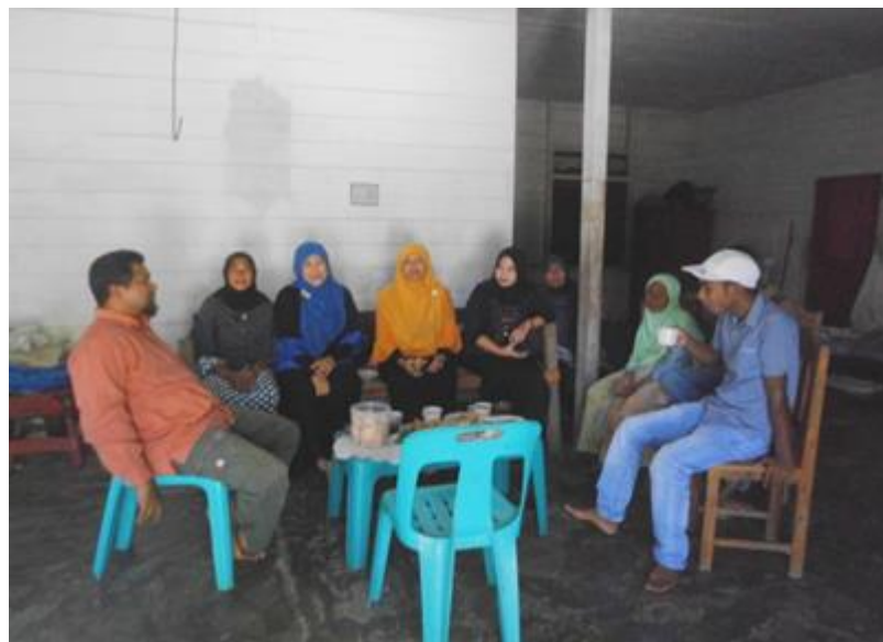
Gambar 1. Sosialisasi kegiatan