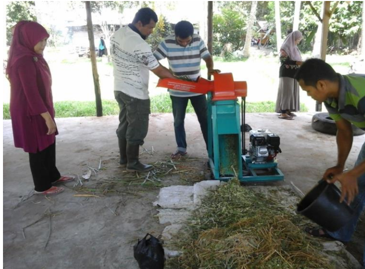
Gambar 4. Pengolahan pakan dengan mesin

Uji coba pemberian olahan dilakukan pada sapi Aceh selama 2 (dua) bulan dengan hasil seperti pada Gambar 5, dimana sapi Aceh mengalami peningkatan berat badan sebesar 0,7 kg perhari atau 10 kg per 2 minggu.