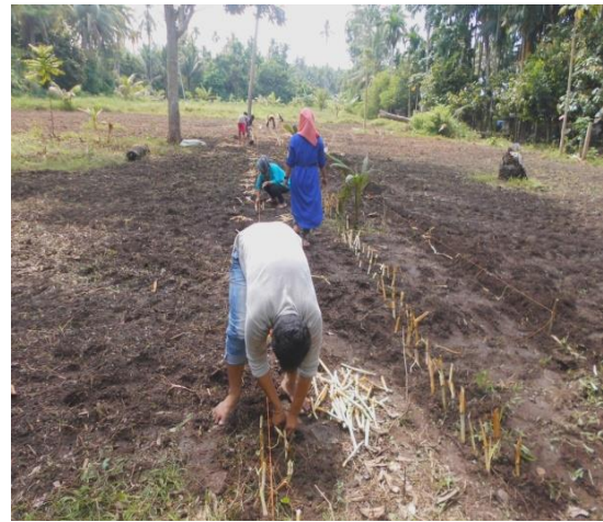
6B. Kegiatan Penanaman Rumput gajah