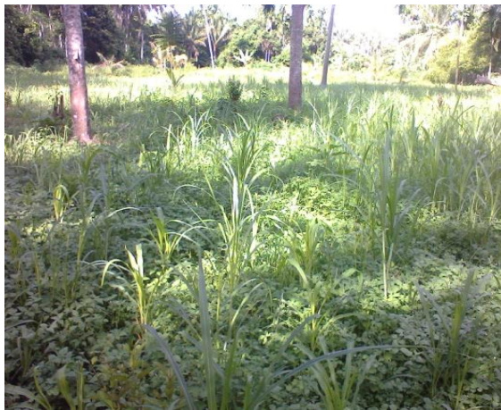
6C. Rumput Gajah yang sudah tumbuh