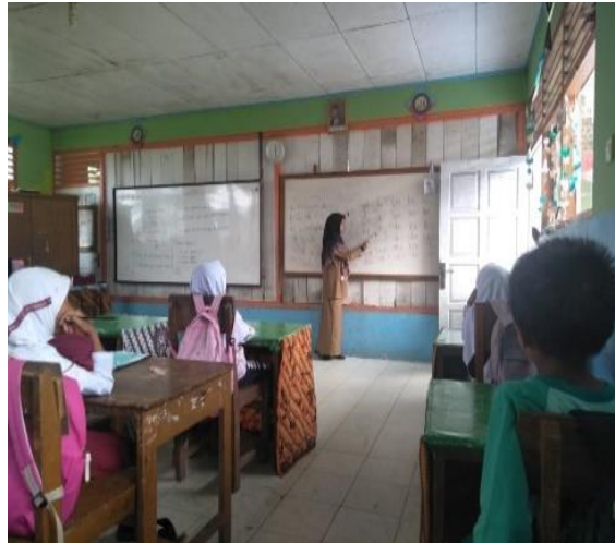
Gambar 3. Kegiatan membaca bersama

meningkatkan keterampilan membaca, menulis, dan pemahaman huruf secara kolaboratif dan personal.