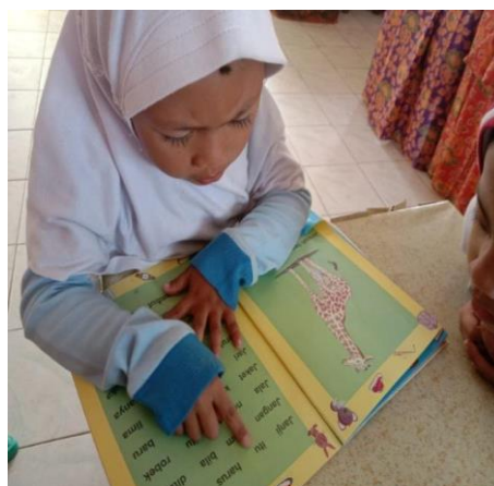
Gambar 5. Kegiatan pendampingan membaca secara pribadi