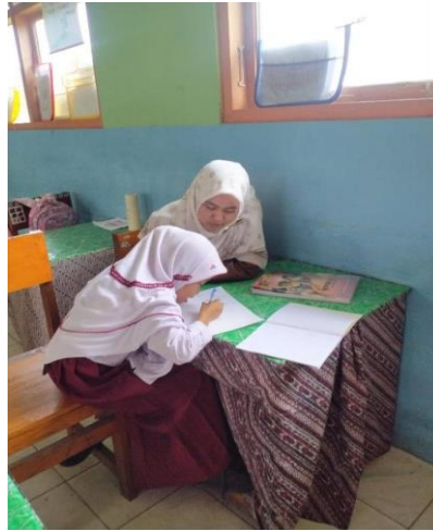
Gambar 6. Kegiatan pendampingan menulis secara pribadi