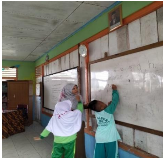
Gambar 4. Kegiatan pendampingan menulis