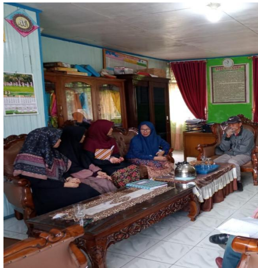
Gambar 2. Diskusi terkait kegiatan CALISTUNG

Tahap ini para tim pengabdian melakukan analisis terhadap sekolah yang akan menjadi tempat melakukan pendampingan Calistung. Terlebih dahulu tim pengabdian mendiskusikan dengan Kepala Sekolah SDN 02 Pariangan ada beberapa kesulitan yang dialami oleh siswanya. Setelah didiskusikan mengenai beberapa kegiatan yang akan dilakukan di sekolah, waktu pelaksanaan dan kebutuhan lainnya. Tim pengabdian akan melaksanakan kegiatan baca tulis berhitung disepakati pada hari senin setelah pulang sekolah. Dalam diskusi juga membahas permasalahan dan kesulitan yang dialami dan menjadi kendalanya. Tujuannya agar tim pengabdian mendapatkan informasi tentang siswa yang mengalami kesulitan atau permasalahan dalam membaca, menulis dan menghitung. Setelah memperoleh informasi agar bisa mencari solusi dari permasalahan sesuai dengan kebutuhan.