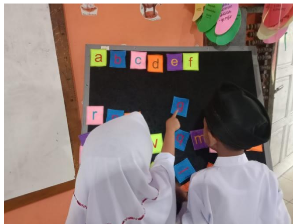
Gambar 7. Kegiatan pendampingan mengenal huruf